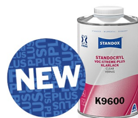
Ny Standocryl VOC-Xtreme-Plus Clear K9600

Inget behov för aktivering av baslacken när du arbetar med hela systemet Xtreme System.