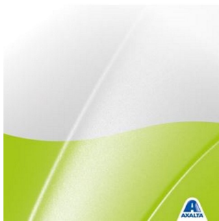
Bakgrunn for personbiler

Etikettene har tre forskjellige typer bakgrunner – en for personbiler, en for kommersielle kjøretøy og en til industriell bruk - for å gjøre produkt differensiering veldig enkelt.