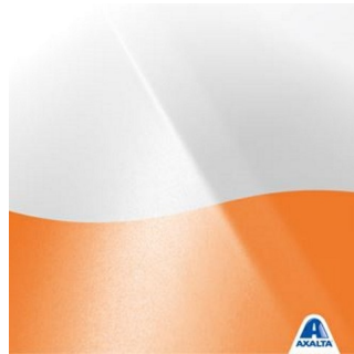
Sfondo per i veicoli commerciali