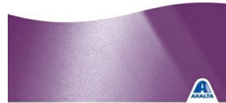
Sfondo per gli usi industriali