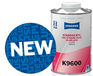
Standocryl VOC-Xtreme-Plus Clear K9600

Le proprietà di lavorazione eccellenti, come l'applicazione flessibile in 1,5 o 2 mani, l'ottimo potere riempitivo e l'eccellente stabilità verticale assicurano una finitura perfetta. Un ulteriore "plus" è rappresentato dalle straordinarie prestazioni di essiccazione che permettono di incrementare la produttività di ridurre sensibilmente il consumo energetico. Uno sguardo al futuro subito!