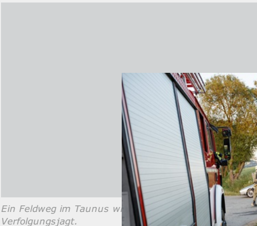
Ein Feldweg im Taunus während der Verfolgungsjagd.

Das beschriebene Bild ist das Mai-Motiv des Standox Kalenders 2018 und zeigt viel Action. Und obwohl es wie ein gezeichneter Comic aussieht: Die drei Alfas waren echt, und bei den Fotoaufnahmen ging einer tatsächlich in Flammen auf. Das Ganze fand allerdings nicht in New York statt – sondern auf einem einsamen Feldweg im Taunus. Und dabei stand die Freiwillige Feuerwehr aus Miehlen mit einem Löschwagen bereit, um aufzupassen, dass die angezündete Giulia (ein nicht mehr restaurierbarer Schrottplatzfund) keinen Schaden anrichten konnte.