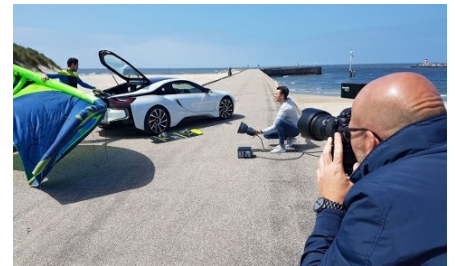
Gute Bedingungen beim Fotoshooting: Ein Aufhellblitz hebt das Gesicht des BMW-Fahrers hervor, die abschließende Bildbearbeitung rundet das Motiv ab.

Blauer Himmel, Sonne, Meer und mitten in der Strandidylle ein weißer BMW i8. Der Besitzer des sportlichen Plug-in-Hybrids, ein in Neopren gehüllter Kitesurfer, nimmt gerade seinen Lenkdrachen aus dem Fahrzeug – bereit für einen Ritt auf den Wellen. Die Bedingungen beim Fotoshooting für das Mai-Motiv sind gut. Nur ein Aufhellblitz ist nötig, um das Gesicht des BMW-Fahrers hervorzuheben. Später, bei der Bildbearbeitung, werden nicht nur die Farben optimiert, sondern auch weitere Kitesurfer eingefügt. Fahrzeug, Motto und Bildkomposition spiegeln den Charakter des Fahrers wider: Hightech und Stilbewusstsein, gepaart mit Liebe zu Meer, Wassersport und Natur.