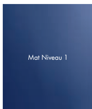
Mat Niveau 1

Avec notre logiciel avancé de gestion numérique des couleurs Standwin iQ, le niveau de brillant est déjà recommandé avec la formule de couleur. Et notre spectrophotomètre Genius IQ vous aide à identifier rapidement et facilement la bonne couleur mate.