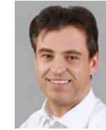
Klaus Sonnberger Werkstattmanagement & Lackierzubehör

PC/Hardware/Standowin: +49/9721/941 45-91