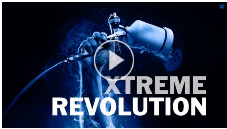
Erleben Sie die Xtreme Revolution mit unserem Video.