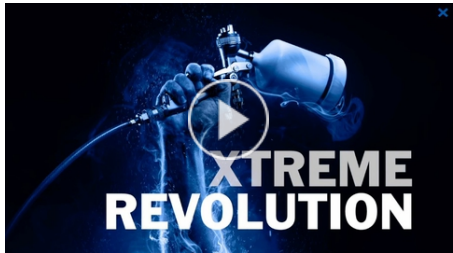
Erleben Sie die Xtreme Revolution mit unserem Video.