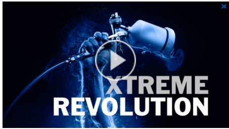
Erleben Sie die Xtreme Revolution mit unserem Video.